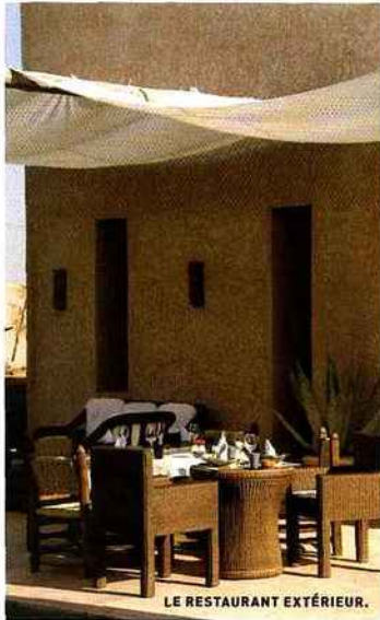
LE RESTAURANT EXTÉRIEUR.