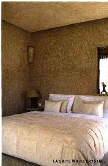
LA SUITE WHITE CRYSTAL.