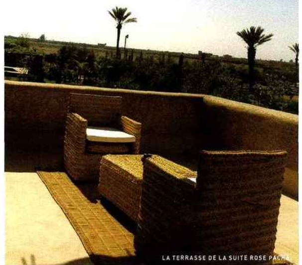
LA TERRASSE DE LA SUITE ROSE PACHA.